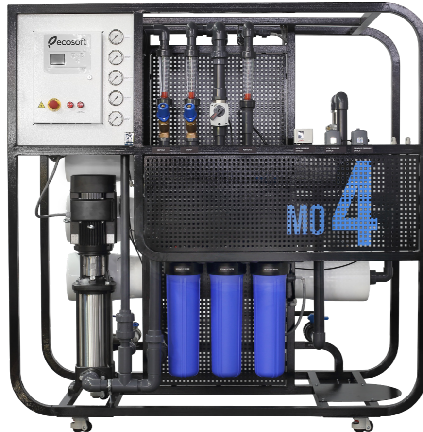
Архитектура установки может быть модифицирована на усмотрение производителя, если это не приведет к существенным изменениям технологической схемы